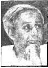
NAVEEN PATNAIK CHIEF MINISTER, ORISSA

Telephone { (0674) : 2531100 (Off.) { (0674) : 2591099 (Res.)