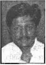
PRATAP JENA MINISTER (S) School & Mass Education Orissa