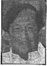
SHRI SURJYA NARAYAN PARTRO MINISTER Revenue & Disaster Management Orissa