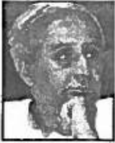
NAVEEN PATNAIK CHIEF MINISTER, ORISSA