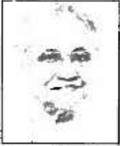
Sheila Dikshit Chief Minister