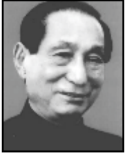
S.C. Jamir GOVERNOR, ODISHA