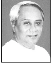
NAVEEN PATNAIK CHIEF MINISTER, ODISHA