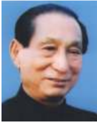
Dr. S. C. JAMIR Governor, Odisha